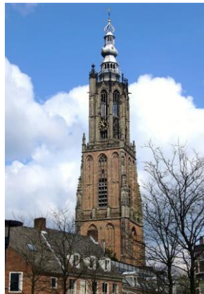
De onze Lieve Vrouwe Toren oftewel de Lange Jan. De op twee na hoogste kerktoren van Nederland.