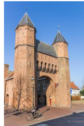
Kamperbinnenpoort , een overblijfsel van de eerste stadsmuur. De poort is gebouwd in de tweede helft van de 13 e eeuw.