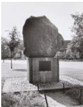
De Amersfoortse Kei is een grote zwerfsteen in Amersfoort, waaraan de stad de bijnaam Keistad en haar inwoners de geuzennaam Keientrekkers danken.

Na de oorlog was er tot ongeveer 1970 sprake van geringe ontwikkeling. Vervolgens verdween de militaire aanwezigheid op één kazerne na. Daardoor dreigde het aantal inwoners zelfs te dalen. Met de annexatie in 1974 van de toenmalige gemeente Hoogland breidde het grondgebied van Amersfoort flink uit. Tegen het einde van de 20e eeuw kreeg de stad een sterke impuls dankzij de Groeistad-status. Dit leidde tot de bouw van nieuwe Vinx- en andere wijken, zoals Kattenbroek, dat door zijn bijzondere architectuur landelijke bekendheid verwierf. In deze periode vestigden zich ook nieuwe bedrijven in Amersfoort. Tegenwoordig wonen er bijna 160.000 mensen in Amersfoort. Het is daarmee qua inwoneraantal de vijftiende stad in Nederland.